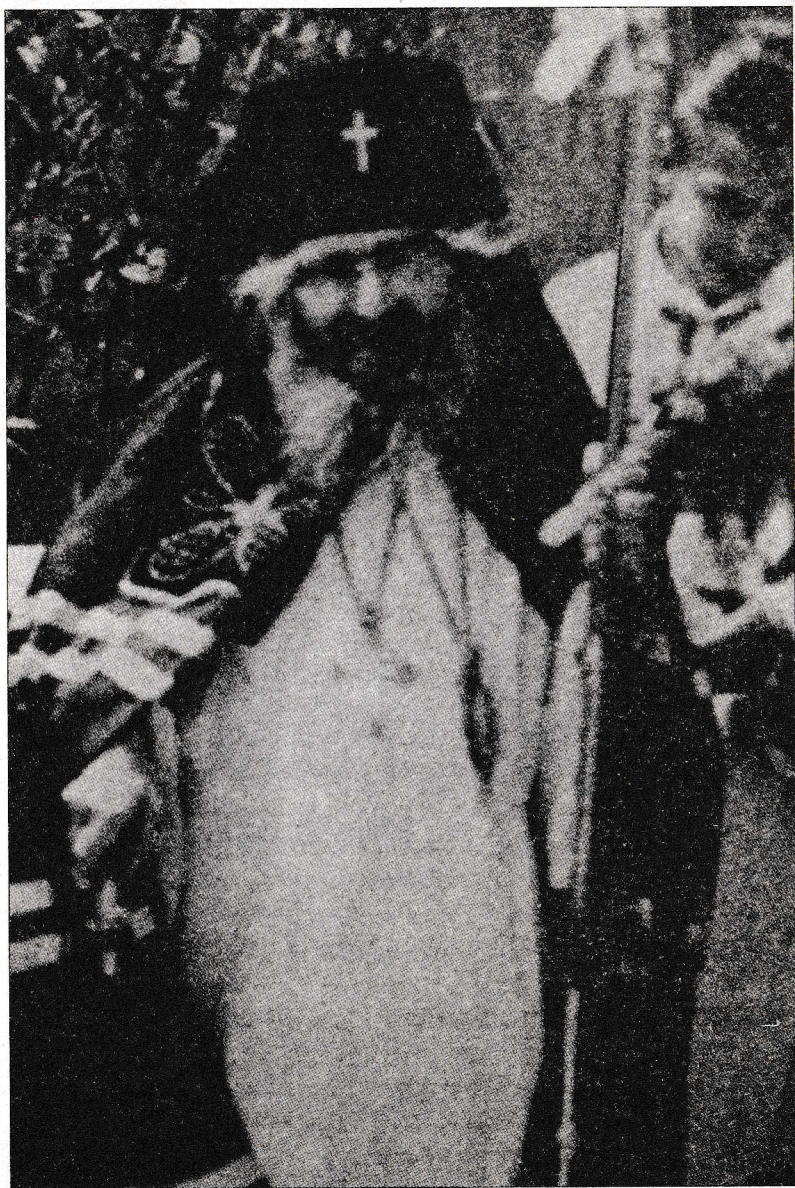
Una dintre cele din urmă fotografii ale Sfântului Arhiepiscop Ioan Maximovici

SPUNE-LE OAMENILOR CĂ, DEȘI AM MURIT, SUNT VIU! LIBRIS we know books